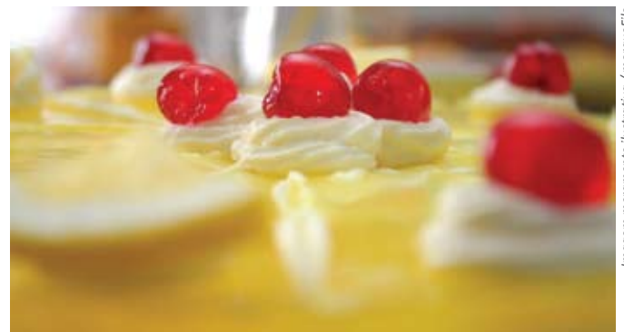
Imagem meramente ilustrativa

Bata as claras em neve, acrescente o açúcar e bata mais um pouco. Acrescente o creme de leite e misture sem bater; despeje sobre o creme. Polvilhe o côco ralado sobre o bolo e leve à geladeira até a hora de servir.