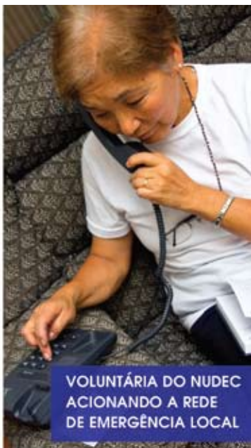
VOLUNTÁRIA DO NUDEC ACIONANDO A REDE DE EMERGÊNCIA LOCAL