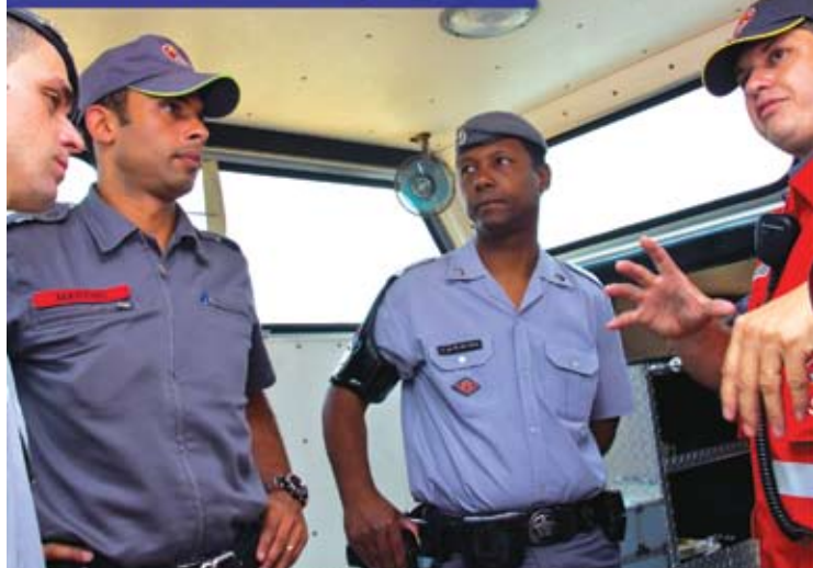
REPRESENTANTES DO PODER PÚBLICO QUE PARTICIPARAM DA AÇÃO