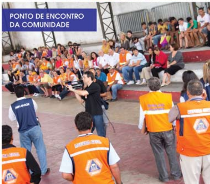
PONTO DE ENCONTRO DA COMUNIDADE