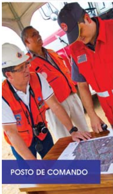
POSTO DE COMANDO