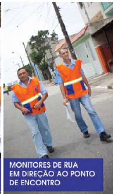
MONITORES DE RUA EM DIREÇÃO AO PONTO DE ENCONTRO